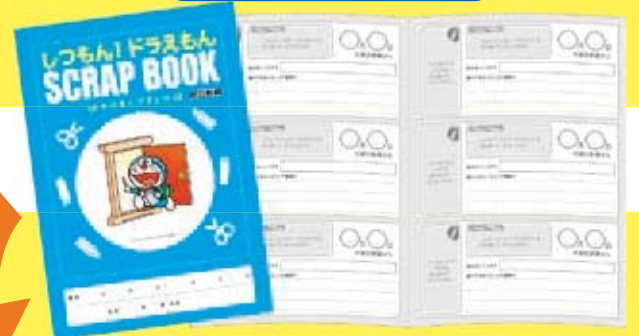
※デザインは変更になる場合があります

★今日の「こたえ」はどこにあるのかな。さがす面白さに加え、毎日変わるドラえもんたちの絵も楽しめます。