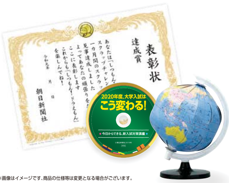
※画像はイメージです、商品の仕様等に変更となる場合がございます。

まんがも読める 学べるQ&Aブック しつもん! ドラえもん 「教えて! スポーツ編」 「教えて! 宇宙・科学編」